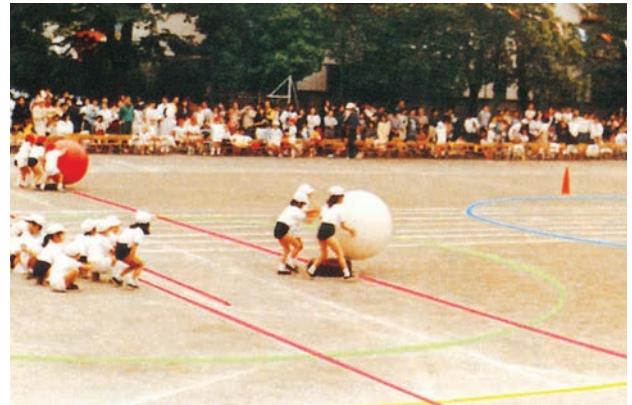
(一財) 東京都学校保健会推薦品