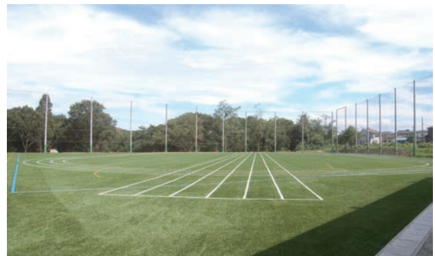
(学法) 大乘淑徳学園グラウンド(千葉)