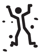
よこあるき (フリークライミング)