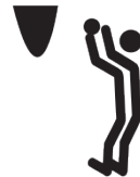
なげいれる (たまいれ)