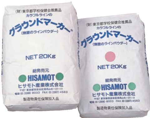
▲グラウンドマーカ― 20kg 紙袋入