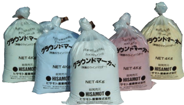
▲グラウンドマーカ― 使い切りセット